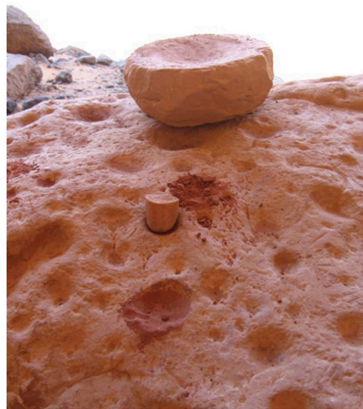
Tadrart, Tassili N'adjer, il y a plus de 10 000 ans